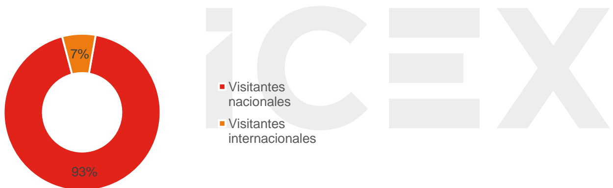
GRÁFICO 2. RELACIÓN DE VISITANTES LOCALES/INTERNACIONALES DE EMITT 2019