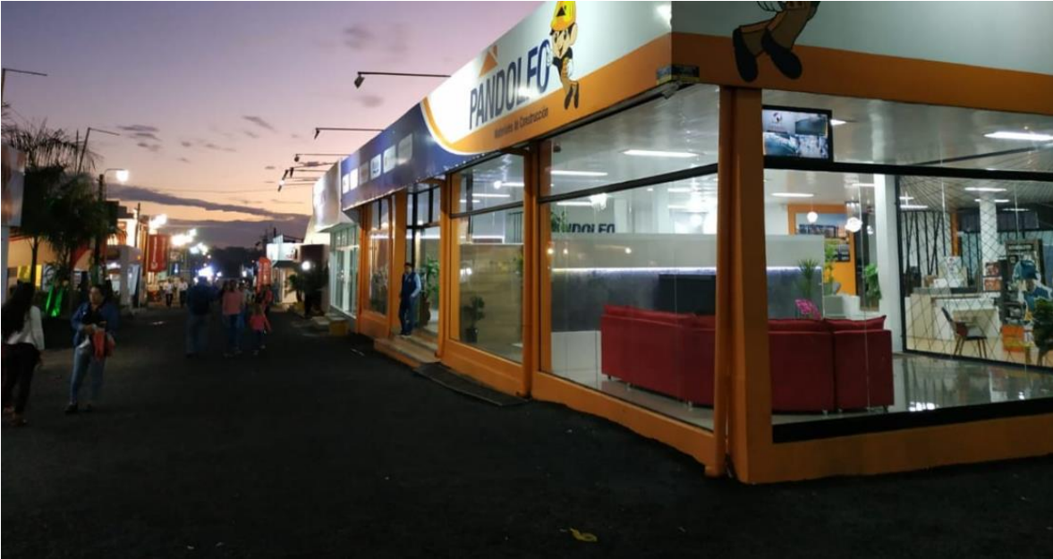
Pasillo hacia la zona este en Expo Santa Rita