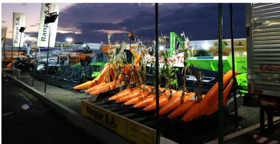
Stand de Ranpar S.A. en Expo Santa Rita