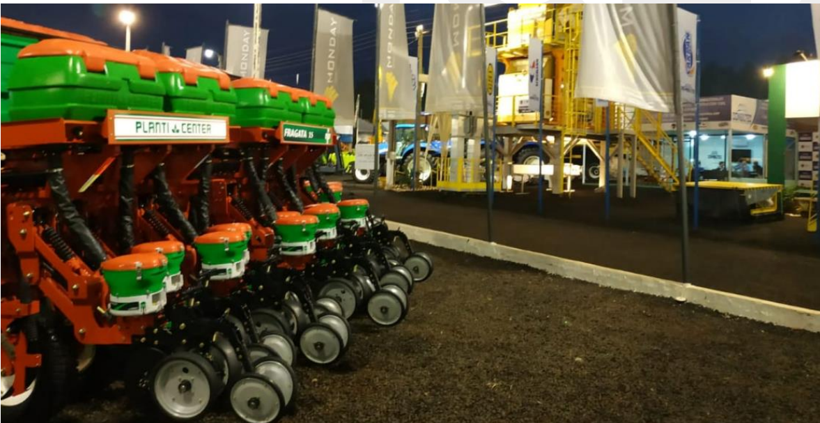
Stand de Monday en Expo Santa Rita