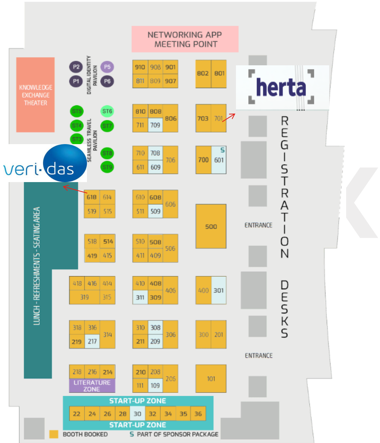
Plano de la Feria.