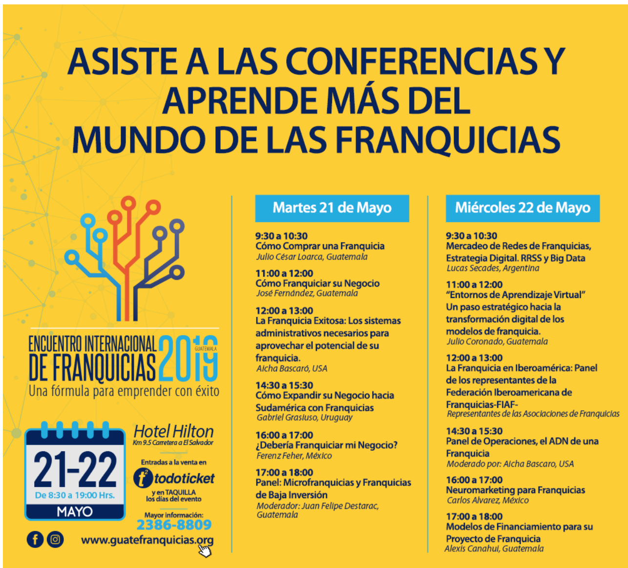
IMAGEN 2. HORARIO DE CONFERENCIAS

A continuación podemos ver la agenda de ambos días: