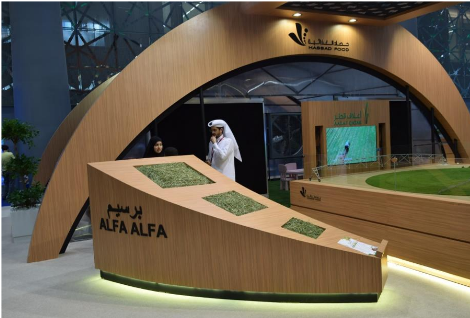
Imagen 1. Foto del stand de Hassad Food, principal empresa inversora de Qatar en los sectores de alimentos y agroindustrias.