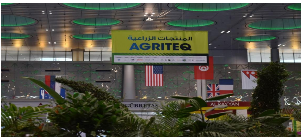
Imagen 2. Foto del Pabellón de Agriteq 2019.