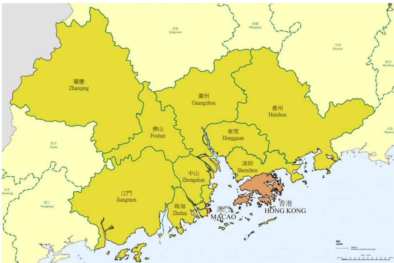
IMAGEN 1: MAPA DE LA GREATER BAY AREA