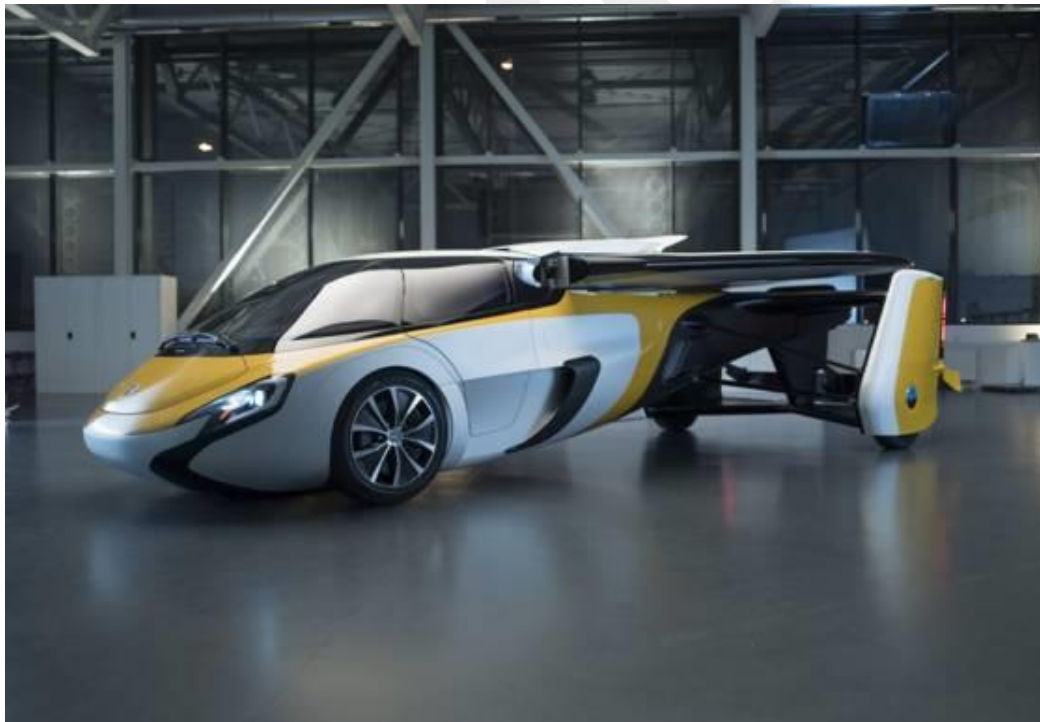
IMAGEN 1. AEROMOBIL

Con la llegada de los patinetes y bicicletas eléctricas a la mayoría de las ciudades, la movilidad urbana ha sido uno de los temas más destacados durante el salón. Se han presentado distintas ideas relacionadas con la movilidad en las smart cities , tales como vehículos autónomos, trenes futuristas y otros productos que prometen revolucionar nuestra vida diaria en los próximos años. Uno de estos ejemplos es el coche volador, que ha cobrado especial relevancia en la edición de este año. A continuación, se muestra una imagen del aeromobil, prototipo de un coche volador desarrollado por una startup eslovaca que podría presentarse aproximadamente dentro de tres años.