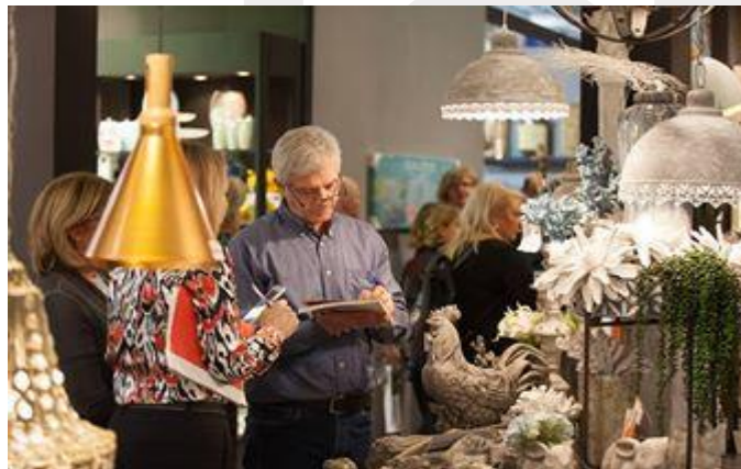
STAND EN MOSTRA ROTA & GIFT SHOW 2019

No hubo expositores españoles, pero se identificó producto español importado por algunas de las empresas participantes, como La Pajarita, fabricante de pinturas para manualidades. Otro ejemplo fue Antonio Juan, marca de muñecas española.