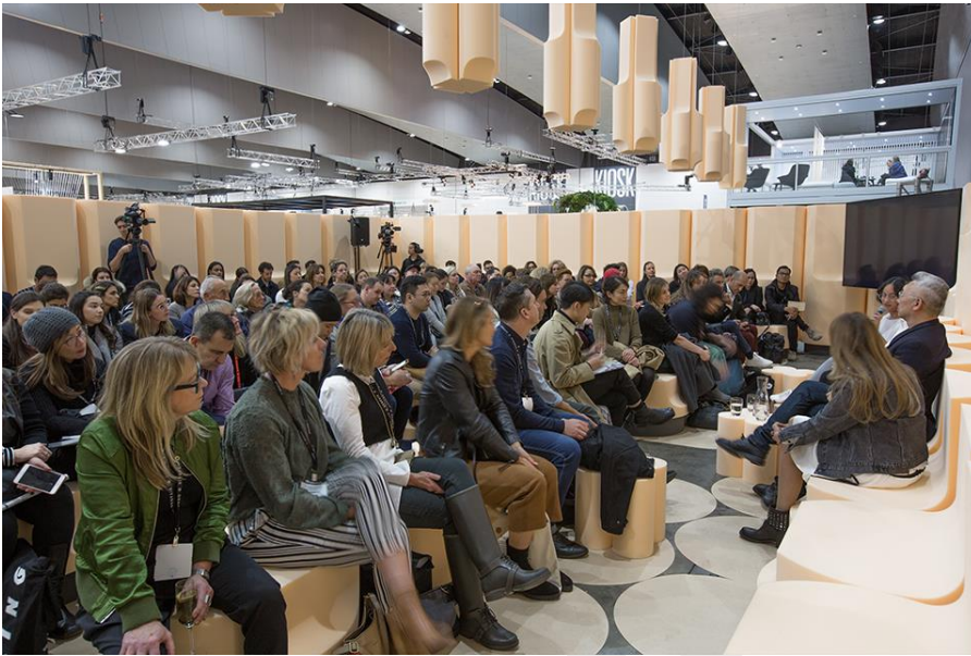
The Speakers Space por Arthur Koutoulas

Entre las actividades incluidas se llevaron a cabo charlas y conferencias relacionadas con el efecto del diseño en ambientes de trabajo y del hogar, la relación entre el diseño y la salud o las oportunidades que la tecnología supone para el diseño, entre otras.