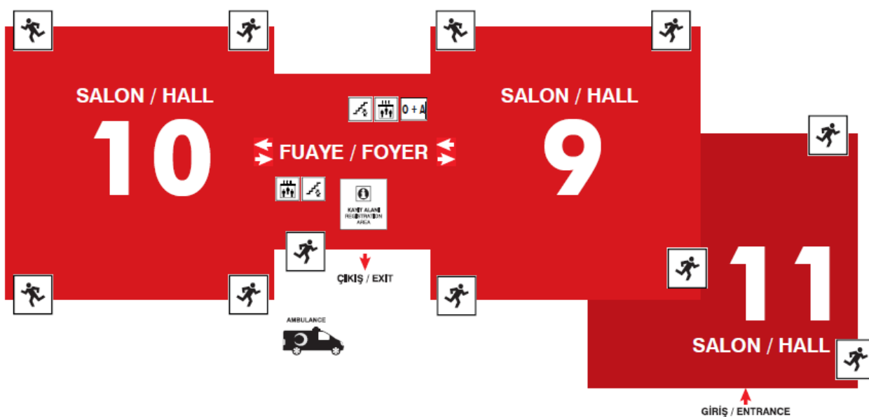
ILUSTRACIÓN 1. PLANO DEL ÁREA DE BEAUTY EURASIA 2019