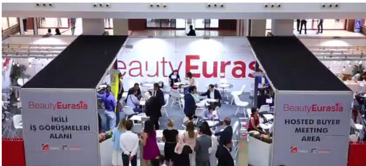
ILUSTRACIÓN 2. IMAGEN DE LA FERIA BEAUTY EURASIA 2019