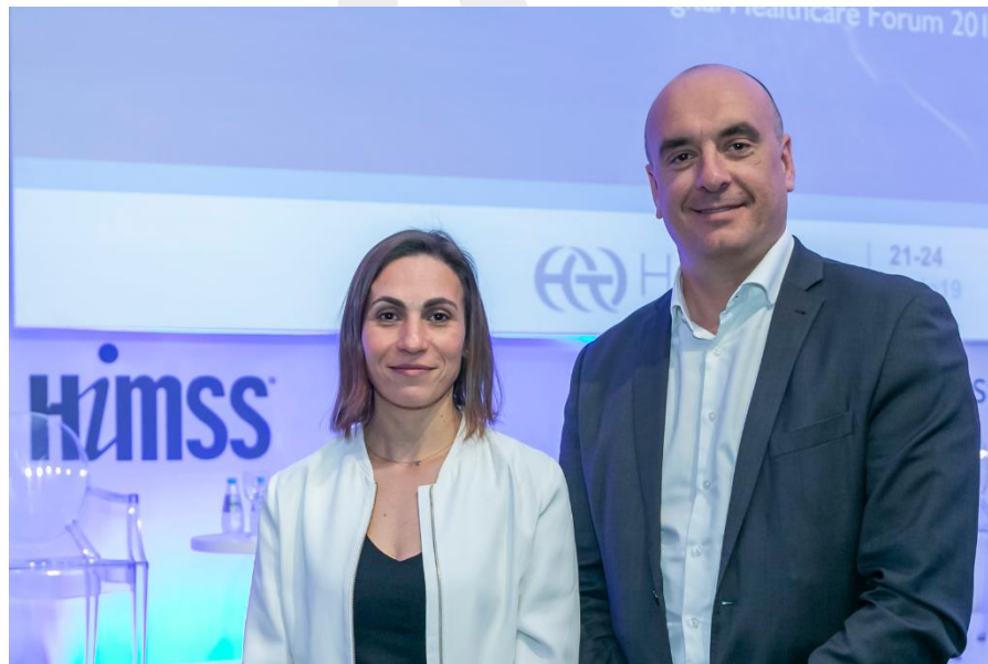
Representantes de Mediktör en la presentación realizada en Hospitalar 2019