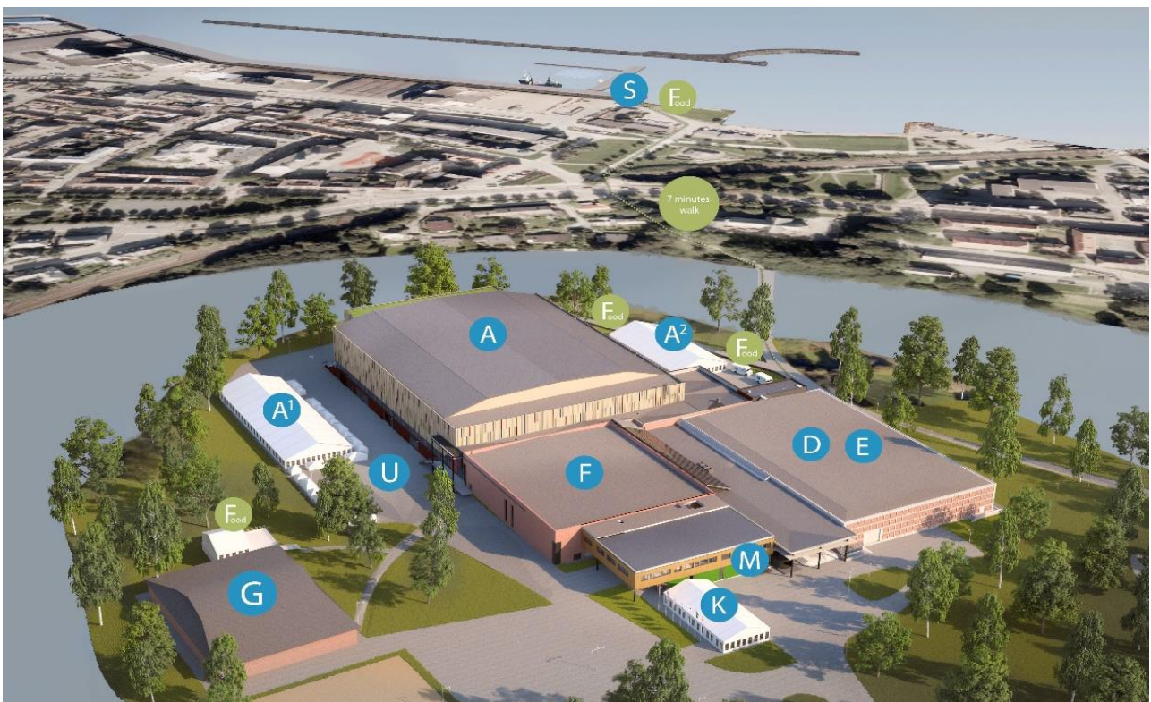
Figura 2.1

Organización y expositores: Aqua Nor 2019 ha sido la vigésimo primera edición de esta cita de carácter bienal. La feria se ha celebrado en el recinto ferial Trondheim Spektrum, ocupando la totalidad de los espacios expositivos del mismo: pabellones A, D, E, F, G, K y M más los espacios anexos exteriores A 1 y A 2 , y el muelle Skansen. El evento ha presentado una superficie expositiva superior a los 15.000m 2 . A continuación, en la figura 2.1, se puede observar la distribución de los espacios de Aqua Nor 2019.