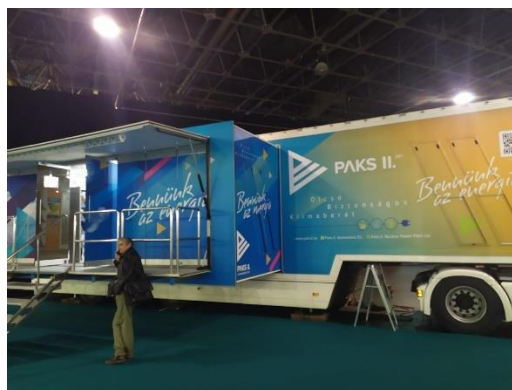
Ilustración 3: Stand destinado a la central nuclear PAKS II

Por otra parte, se dedicó un espacio a la promoción de la energía nuclear, concretamente a la promoción de los programas formativos y de becas otorgadas por la central nuclear húngara "PAKS II". Esto fue algo novedoso dado que es el primer año que se realiza este tipo de promoción en esta feria.