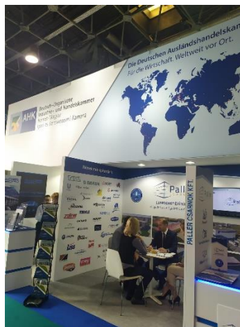
Ilustración 4: Sección de stands de la industria alemana

Cabe destacar la participación de grandes empresas alemanas, japonesas, austríacas y taiwanesas con la presencia de las principales marcas (Audi, Mercedes, Suzuki...) establecidas en Hungría. Como se destacó anteriormente, la representación española fue muy escasa, contando solo con la empresa Ames dentro de un clúster de empresas.