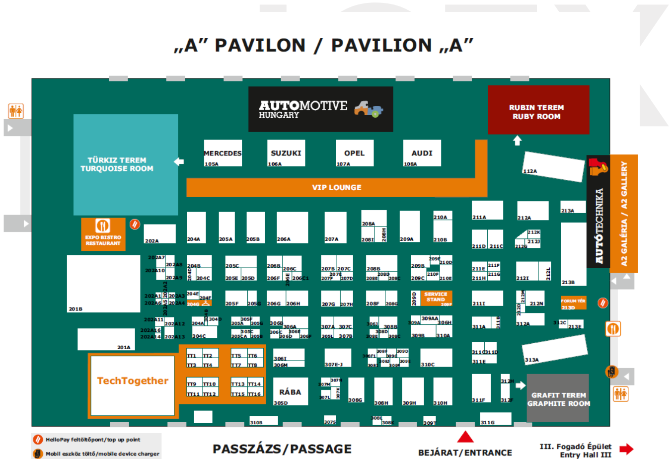
Ilustración 1: Plano del recinto

El espacio reservado para el evento fue el pabellón A del Centro de Exposiciones de Budapest, Hungexpo que tiene una extensión aproximada de 20.000 metros cuadrados. En él, se organizaron conjuntamente los stands destinados a ambas exposiciones. El mapa del recinto es el siguiente: