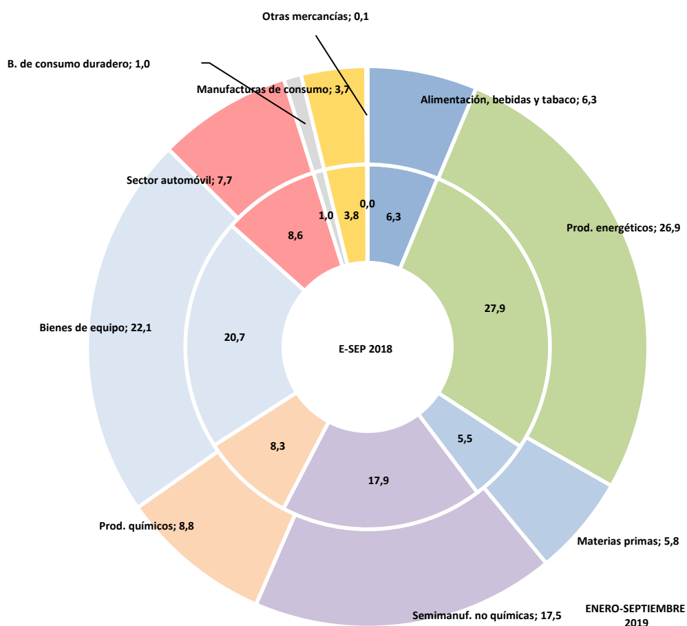
Gráfico 4: Importaciones (% sobre total)

En cuanto a las importaciones de País Vasco, las principales contribuciones positivas en el periodo enero-septiembre provinieron de los sectores de bienes de equipo (contribución de 1,6 puntos), productos químicos (contribución de 0,6 puntos), materias primas (contribución de 0,3 puntos) y alimentación, bebidas y tabaco (contribución de 0,1 puntos). Las mayores contribuciones negativas provinieron del sector de productos energéticos (contribución de -0,8 puntos), sector automóvil (contribución de -0,8 puntos) y semimanufacturas no químicas (contribución de -0,3 puntos).