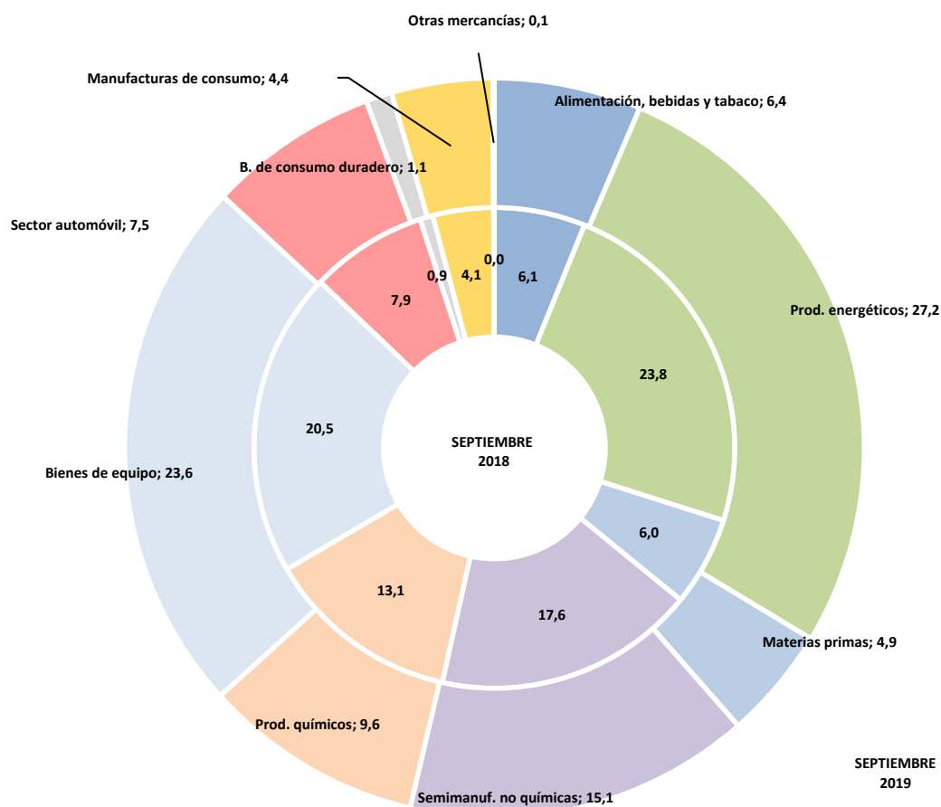
Gráfico 2: Importaciones del País Vasco (%sobre total)

Las mayores contribuciones negativas fueron de los sectores de productos químicos (contribución de -4,3 puntos), semimanufacturas no químicas (contribución de -3,8 puntos), materias primas (contribución de -1,6 puntos) y sector automóvil (contribución de -1,1 puntos).