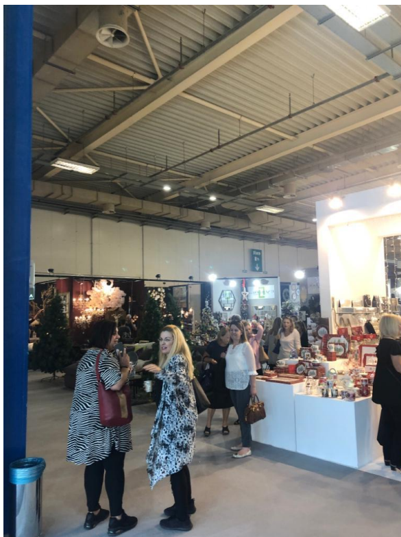
STAND EN MOSTRA ROTA & GIFT SHOW 2019

No hubo expositores españoles, aunque algunas empresas distribuidoras contaban con producto español entre su oferta, como por ejemplo, una marca de cuchillos (El Cid). Había una gran presencia de producto italiano (cristalería y cerámica del hogar), chino (todo tipo de productos) o francés (cuchillería o cristalería). También hubo presencia de grandes marcas como Paul Frank.