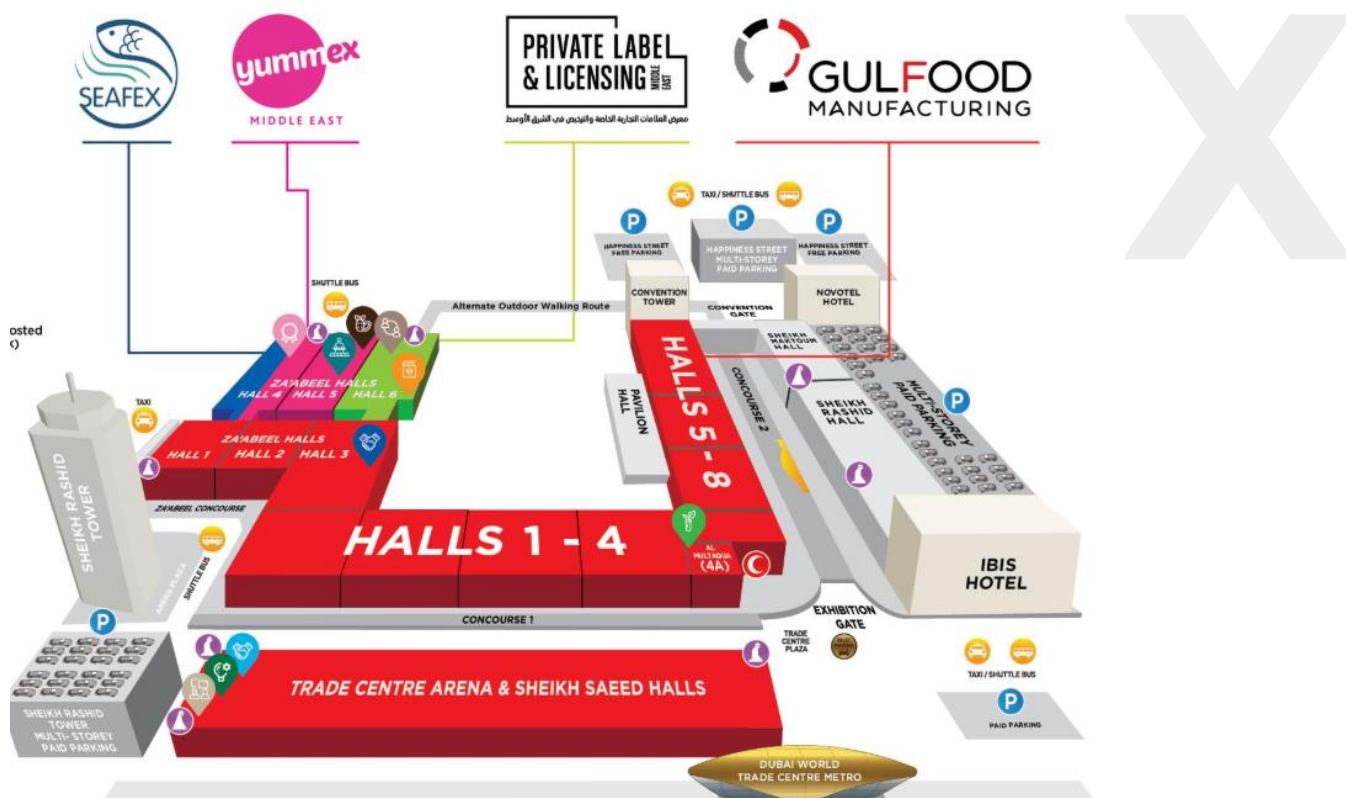
FOTOGRAFÍA 1: DISTRIBUCIÓN DEL ESPACIO YUMMEX, SEAFEX Y PRIVATE LABEL & LICENSING 2019

Las tres ferias a las que hace referencia este informe se celebraron en los pabellones Za'Abeel 4, 5 y 6. La localización de las ferias es mejorable ya que se encuentran alejadas de los principales puntos de accesos a la feria. En la fotografía inferior se muestra la distribución del espacio de la feria: