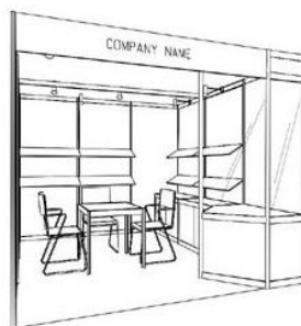
Stand personalizado Opción B