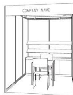
Stand 6m 2 Opción C