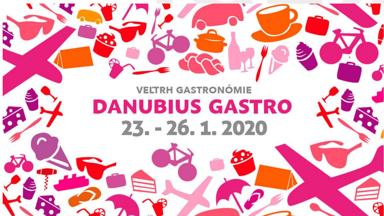
Incheba Expo.