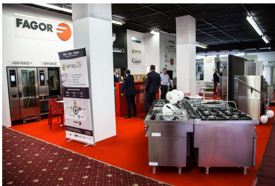
Foto: Danubius Gastro 2020. Stand de Fagor.

Entre los asistentes al evento, se encontraba la empresa española Fagor Gastro representando a su sede en Strašnice en República Checa, con un stand donde mostraban diferentes electrodomésticos para la industria hostelera.