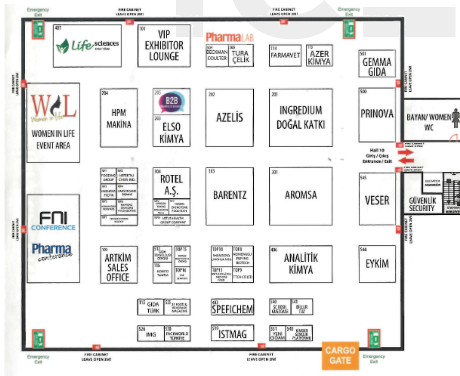
Ilustración 1. Plano del área de Life Sciences 2019. Hall 10

La presente edición de la feria contó con más de 300 compañías exhibidoras, que presentaron marcas procedentes de más de 25 países.