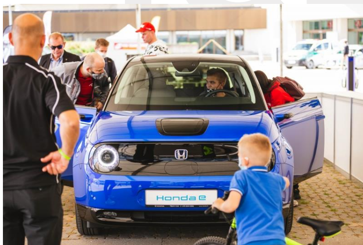
Coche eléctrico Honda e, AUTO BAZAR 2020

Concretamente, los modelos eléctricos que se han sumado a esta feria han sido cinco: Peugeot 2008, Peugeot 208, Hyundai Kona Electric, Nissan Leaf, y el Honda e. Este último modelo, es una de las últimas novedades del mercado, que se presentará por primera vez al público en el mundo en AUTO BAZAR 2020. También, los modelos Peugeot e-208 y SUV e-2008 son modelos bastante recientes en el mercado de coches eléctricos. Por su parte, los modelos Hyundai Kona Electric y Nissan Leaf ya gozan de cierto reconocimiento en el mercado lituano gracias a su precio asequible y excelentes características técnicas.