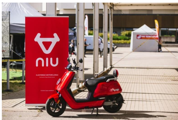
Scooter eléctrica NIU, AUTO BAZAR 2020

Durante la exhibición, los visitantes tuvieron ocasión de probar estas scooter durante 30 minutos, pudiendo elegir entre los trece modelos disponibles en la feria.