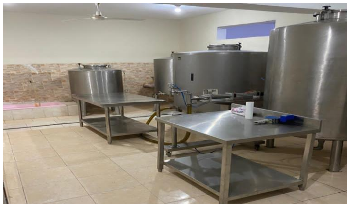
Tolvas de aceite de oliva en la fábrica de Bayt Zaytoun de Polat Makina.

La impresión generalizada de los productos de procedencia española es de alta calidad. Sin embargo, debido a la depreciación de la libra a finales de 2016, el producto europeo se encareció considerablemente, por lo que los egipcios han acudido a mercados como el turco, que, gracias a su experiencia en el sector y precios más asequibles, se ha posicionado como uno de los principales productores y exportadores de equipamiento oleícola. Además, también existe presencia de producto italiano; pese a que los precios son considerablemente más elevados, la calidad italiana es percibida como la mejor en este mercado. Cabe señalar que China, uno de los países líderes en exportación de maquinaria agrícola a Egipto, no está involucrada en el sector oleícola, ya que la industria china de este tipo de maquinaria no se encuentra fuertemente desarrollada.