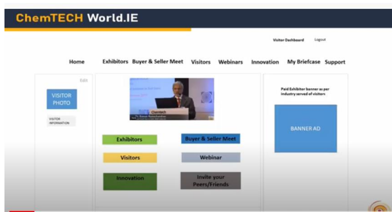
Recepción ChemTECH World 2021, fuente: ChemTECH.

En cuanto al aspecto técnico de la misma, se accedía mediante un link y en el mismo la feria estaba organizada como se muestra a continuación: