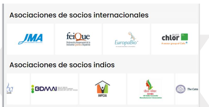
Asociaciones ChemTECH World 2021, fuente: ChemTECH.

Aparte de patrocinadores, la feria ha contado con el apoyo de asociaciones de socios internacionales entre las cuales destaca la asociación española FEIQUE (Federación Empresarial de la Industria Química Española) y la Asociación Europea de Bioindustrias (EuropaBio), España. Además, también ha confiado en asociaciones de socios indios.