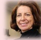
Marianne Fay Directora del Banco Mundial para Bolivia, Chile, Ecuador y Perú

Por último, en la tabla 7 se refleja el total los contratos adjudicados que ascienden a un total de $1.930.816.903 dólares. El sector predominante es el transporte ($1.744.368.080), seguido de agua y saneamiento ($142.613.682) y educación ($40.947.321,8).