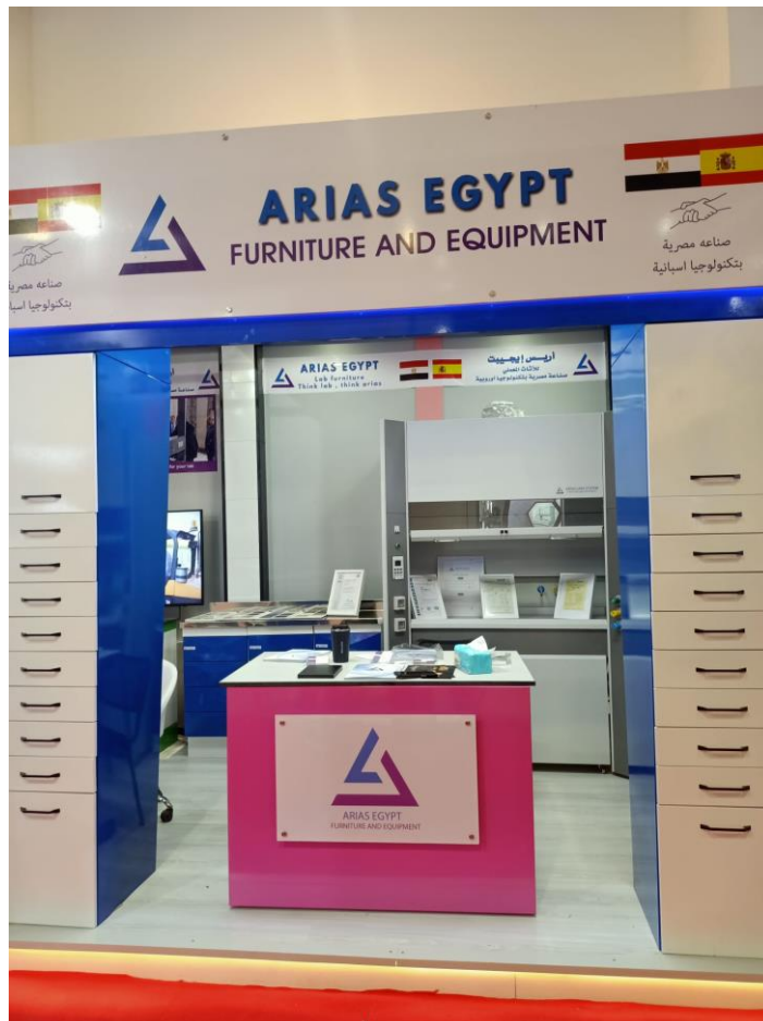
Stand de Arias Egypt

Se dedican a la fabricación de mobiliario y equipos para centros médicos y laboratorios. Con sede en Madrid, están presentes en Arabia Saudí, Marruecos y Egipto. En este último país tienen una fábrica, donde producen sus productos con tecnología europea.