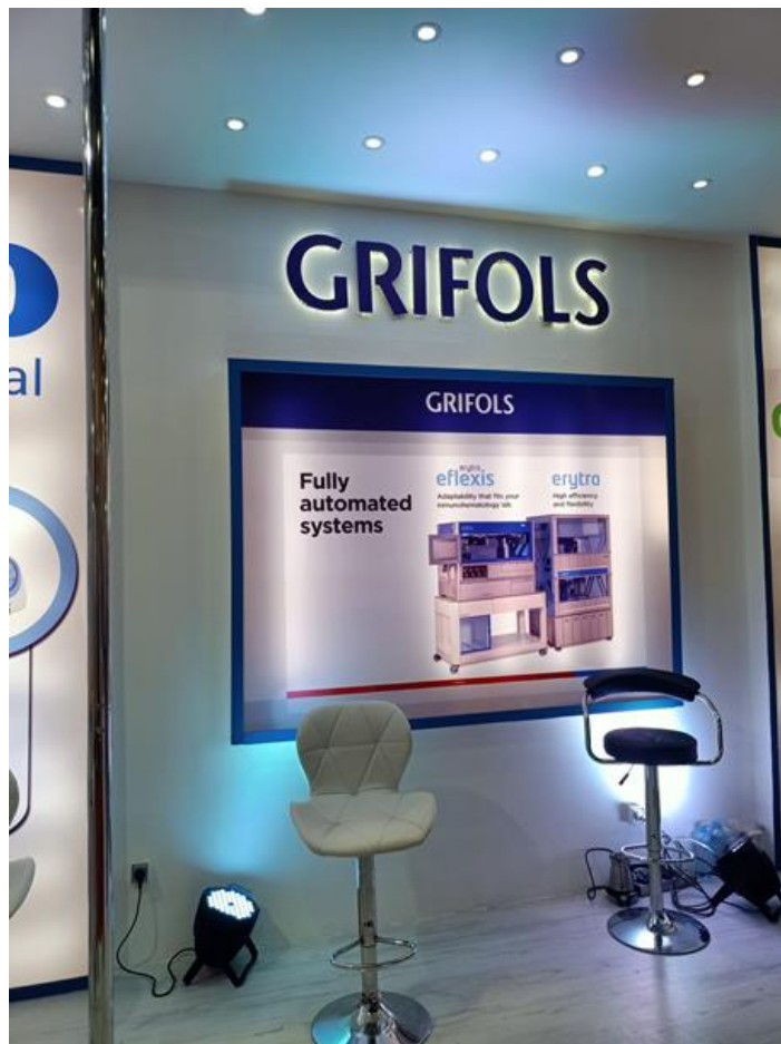
Stand de Griols

Empresa catalana especializada en el sector farmacéutico y hospitalario, cuenta con 4 divisiones: Bioscience, Diagnostic, Hospital y Bio Supplies que desarrollan, producen y comercializan soluciones y servicios innovadores.