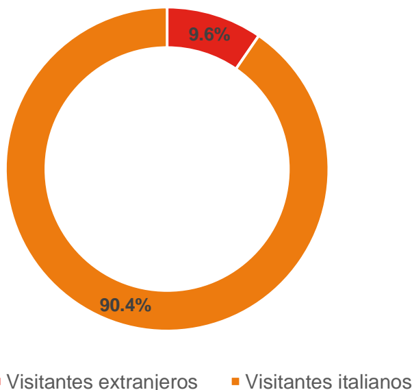
GRÁFICO 3. PROPORCIÓN DE VISITANTES ITALIANOS FRENTE A VISITANTES EXTRANJEROS