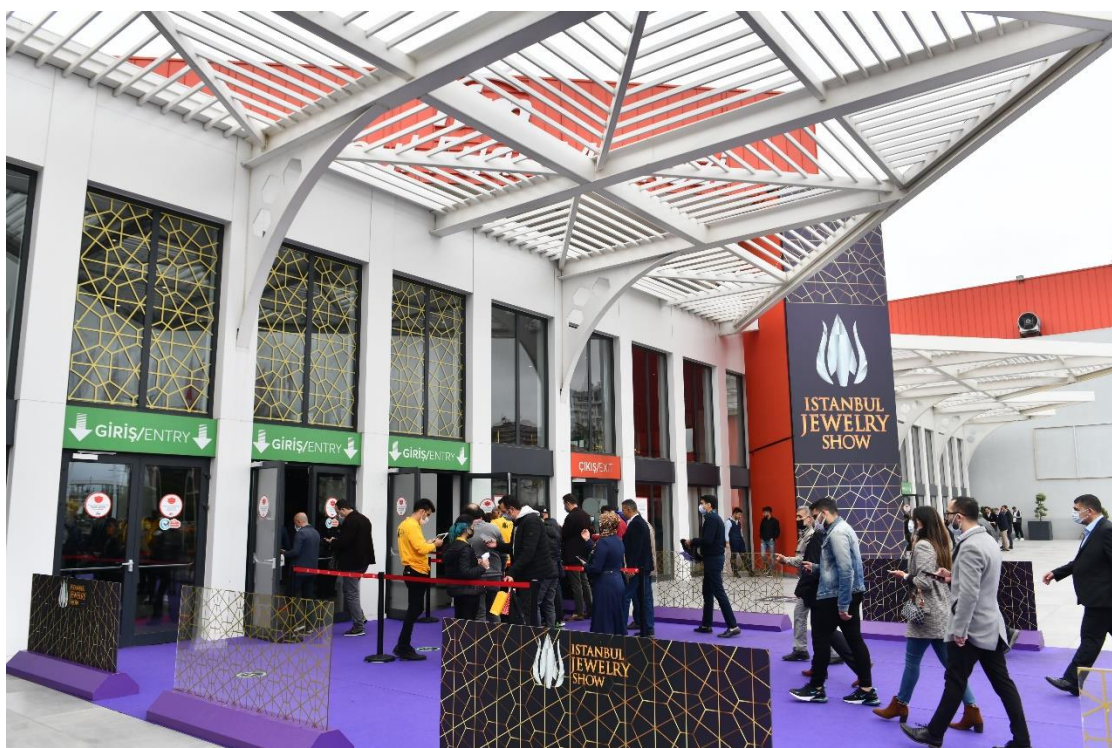
IMAGEN 1: ACCESO A LA FERIA

Un representante de la Oficina Económica y Comercial de la Embajada de España en Estambul ha asistido a la feria para la elaboración del presente informe.