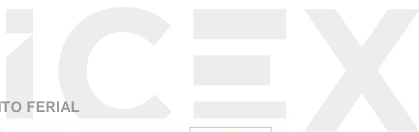
ILUSTRACIÓN 1. PLANO DEL RECINTO FERIAL