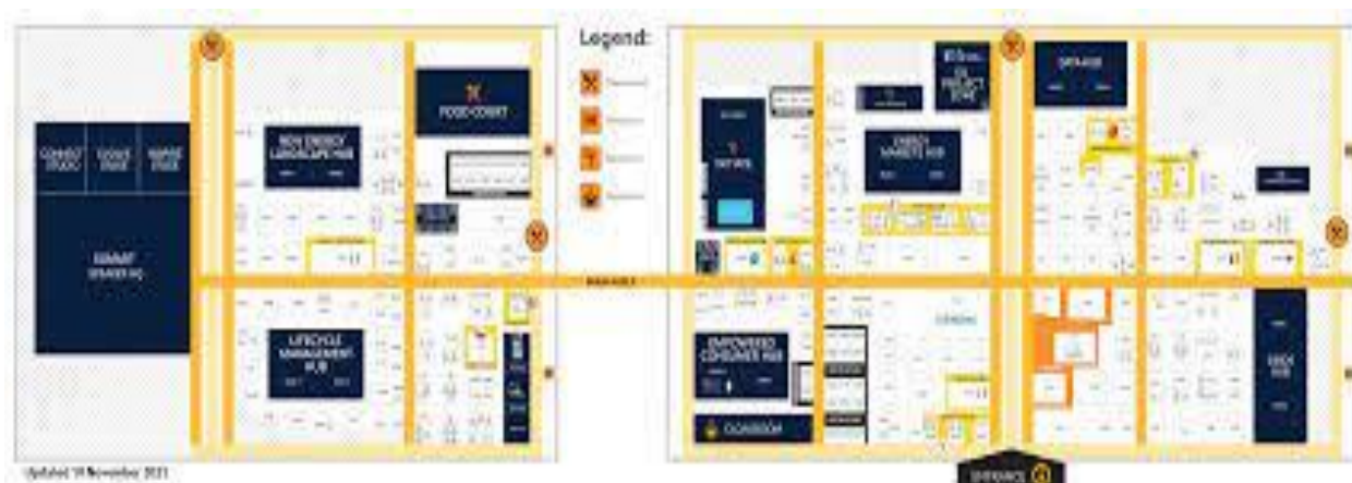
ILUSTRACIÓN 1. PLANO DEL RECINTO FERIAL

En esta edición, la Feria se desarrolló entre los pabellones 8, 12, y 16.