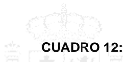
CUADRO 12: EXPORTACIONES BILATERALES POR SECTORES