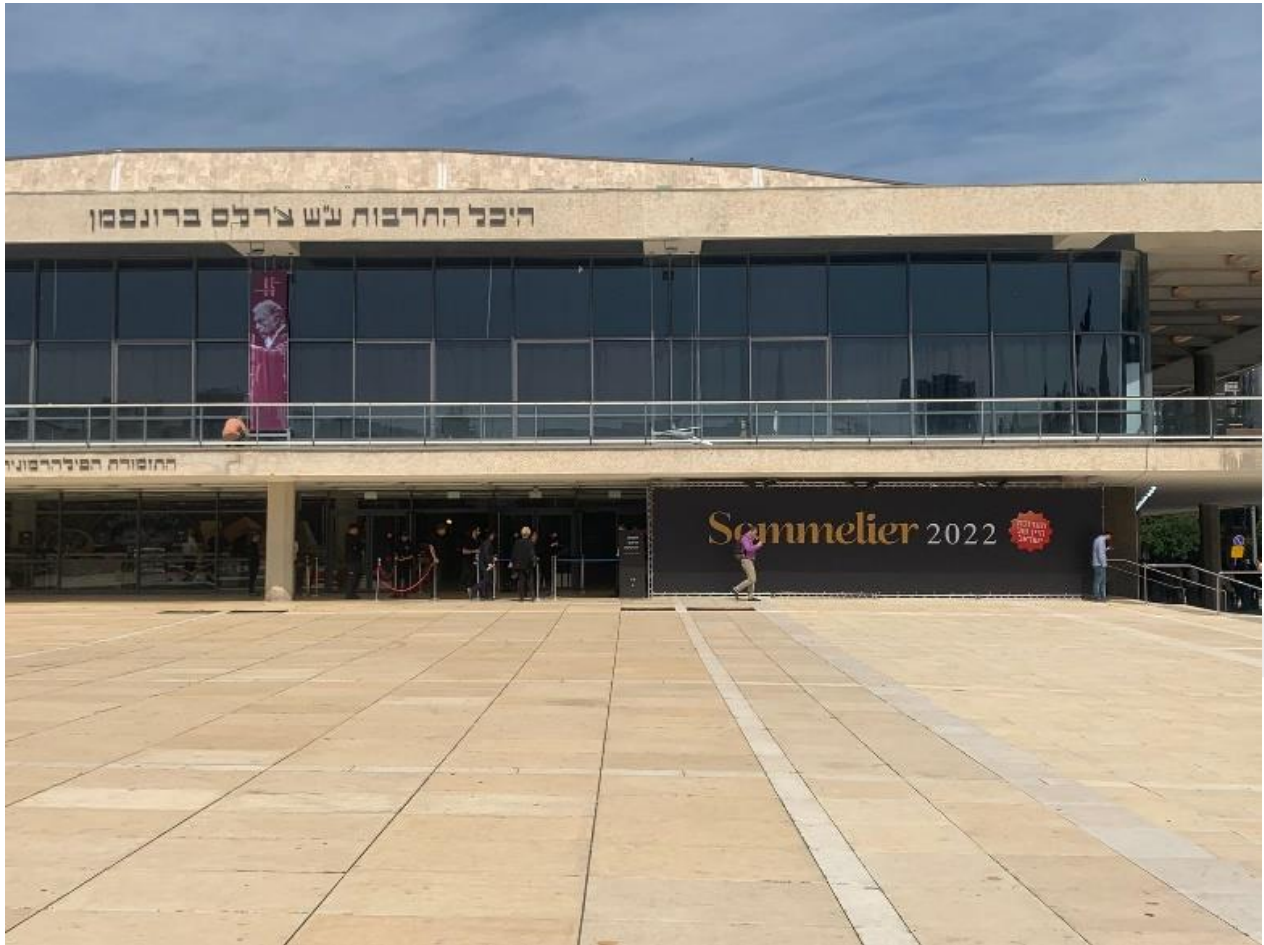
Palacio de la Cultura de Tel Aviv.