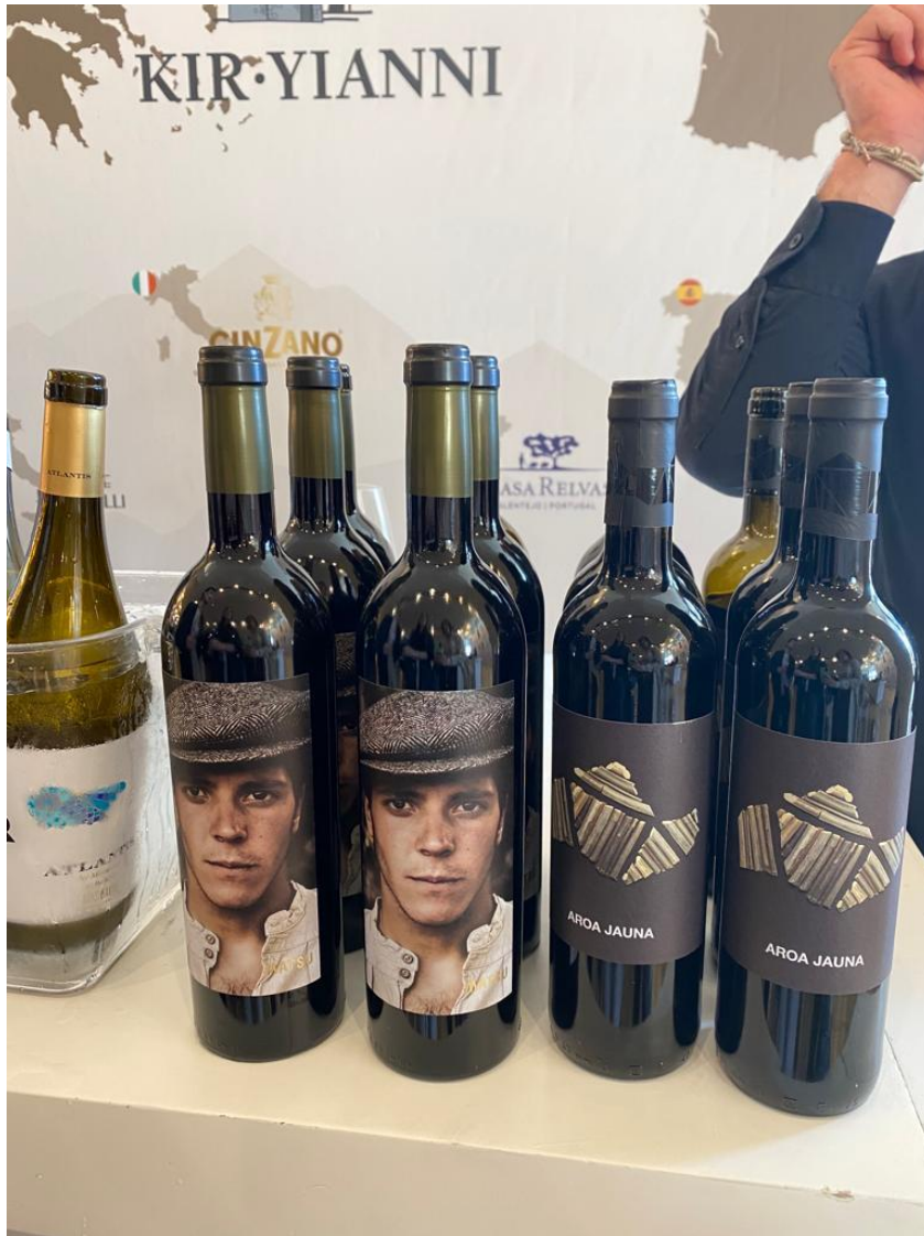
Vinos españoles en Sommelier 2022.