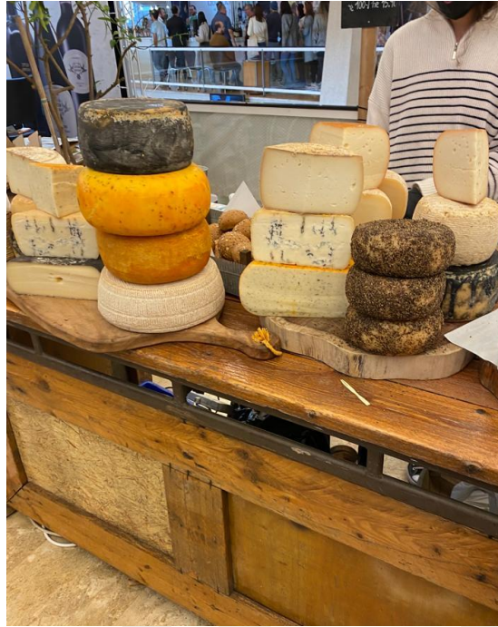
Venta de quesos en Sommelier 2022.