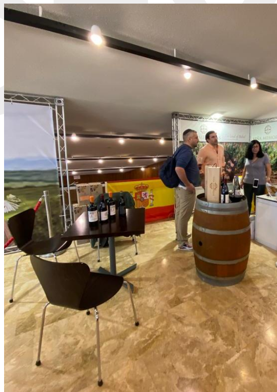
Estand de la bodega Viña Memorias.

Pese a que no había más bodegas españolas representadas con stand propio, sí se podían encontrar una amplia variedad de vinos españoles en los espacios expositores de importadores y distribuidores. Profesionales del sector en Israel coinciden en que los vinos españoles ofrecen una altísima relación calidad-precio, incluso más que los locales, y Rioja, Ribera del Duero y Albariño se posicionan como las denominaciones de origen que más gusto suscitan en el país.