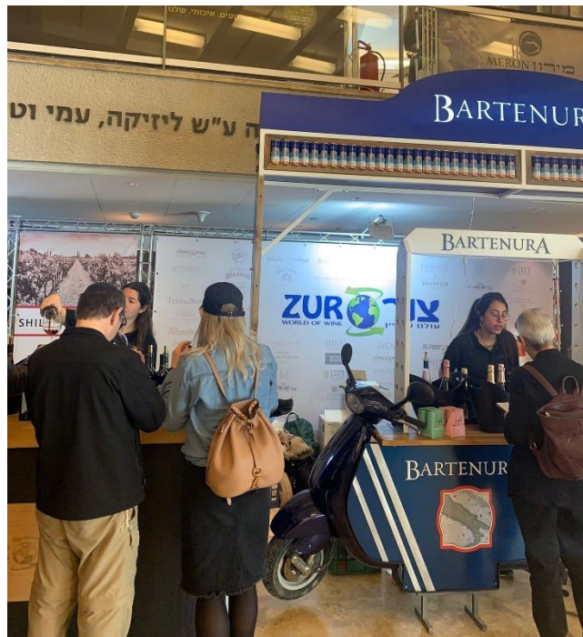
Estands en Sommelier 2022.