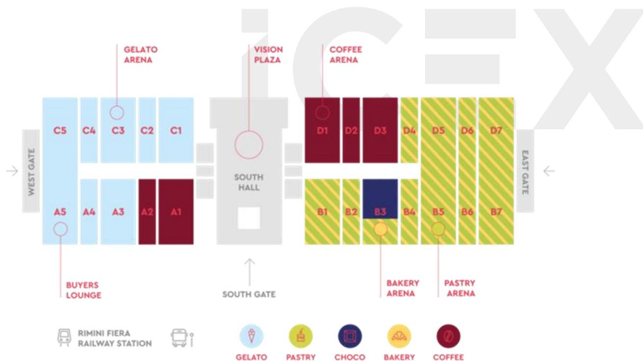
PLANO DE LOS PABELLONES FERIA SIGEP 2022