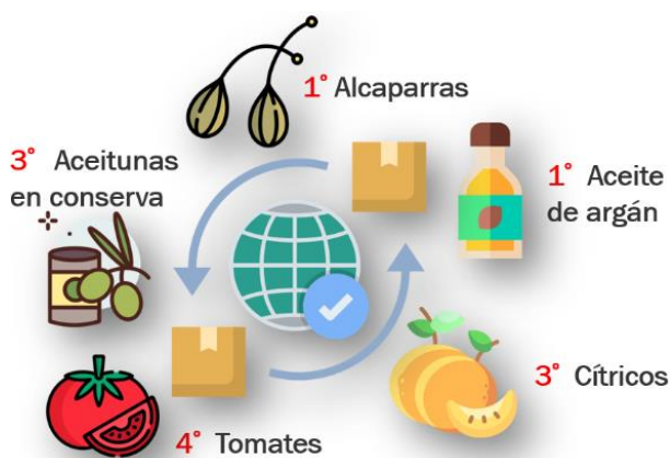
GRÁFICO 1. PRODUCTOS MÁS EXPORTADOS POR MARRUECOS Y SU CLASIFICACIÓN MUNDIAL

Marruecos es también un gran exportador de productos agroalimentarios a nivel mundial, ocupando en muchos casos los primeros puestos en cifras de exportación. En el Gráfico 1 se recogen aquellos productos más exportados por Marruecos y su clasificación mundial por volumen: destacan las alcaparras y el aceite de argán (ADA, 2023).