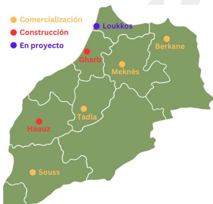
GRÁFICO 4. LOCALIZACIÓN DE LOS AGROPOLOS Y ESTADO DE DESARROLLO

Con el fin de concentrar actividades del sector y mejorar la competitividad, se establecen por todo Marruecos zonas de desarrollo industrial y tecnológico que atraigan inversión extranjera en el sector agroindustrial. Además, existen incentivos como exenciones fiscales a las empresas que quieran establecerse en dichas zonas, una reducción al 20 % en el IRPF o al 17,5 % en el Impuesto de Sociedades (ADA, 2023). Estas zonas reciben el nombre de agropolos , y son proyectos de colaboración público-privada centrandose cada sector en una zona específica con gran potencial de producción, en la que integrar todas las actividades de la cadena de valor de dicho sector, fortaleciendo la competitividad de las empresas. Estos agropolos permiten que el acceso a terrenos sea a precios más asequibles, facilitan la concesión de servicios (infraestructuras de distribución, control de exportaciones, ventanilla única con aduanas, servicios de laboratorio y control sanitario, etc.), la concentración de medios para la transformación alimentaria y las industrias relacionadas (envase y embalaje), y todo tipo de servicios de acompañamiento y certificación relacionados con la agricultura: ONSSA, EACCE, INRA, etc. Ministère de l'Agriculture, 2023).