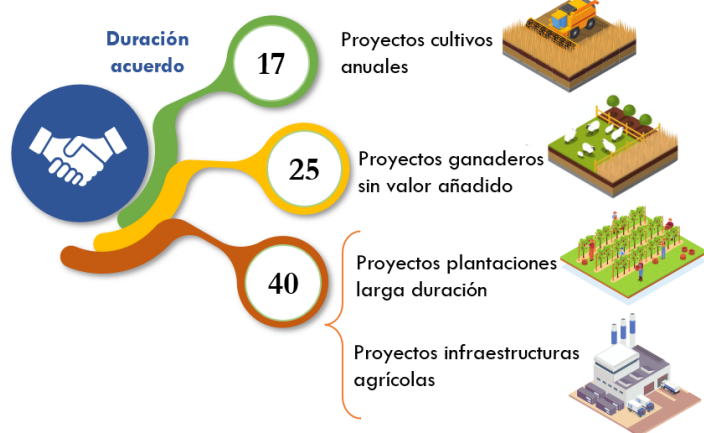
GRÁFICO 3. TIPOS DE CONTRATO DE ARRENDAMIENTO AGRÍCOLA

Según el Banco Mundial, el 67,4 % de la superficie de Marruecos son tierras agrícolas, sin embargo, apenas un 13 % (9,5 millones de ha) es considerada superficie agrícola utilizada (SAU). Con el objetivo de fomentar la agricultura y atraer inversión se promulgó la Ley n.º 04-12 sobre la agregación agrícola, que permite el arrendamiento a largo plazo de tierras agrícolas con fines productivos e industriales independientemente del origen de la inversión, y define las cláusulas obligatorias que deben incluirse en los contratos de agregación, así como los órganos de mediación.