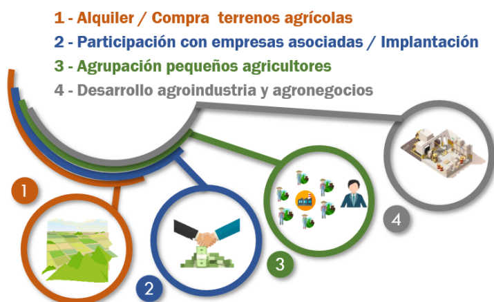
GRÁFICO 5. MODALIDADES DE PARTICIPACIÓN EN EL SECTOR

y procesado es la más atractiva para empresas españolas, ya que el know-how puede marcar diferencias y las ayudas gubernamentales son muy atractivas (ADA, 2023).