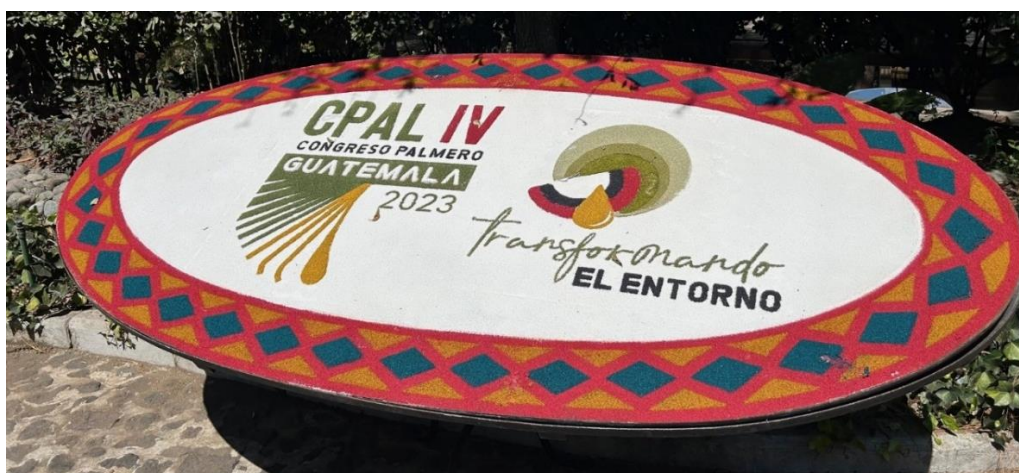
Imagen 1: Bienvenida al evento CPAL IV

La importancia de las relaciones comerciales entre España y Guatemala en términos de aceite de palma se ve reflejada en las importaciones que hace España al país centroamericano. En 2022 rondó los 230 millones de euros y, en 2023, según datos provisionales, los 160 millones de euros. De la totalidad de exportaciones que hace Guatemala a España, el 55 % son de aceite de palma (DataComex, 2022).