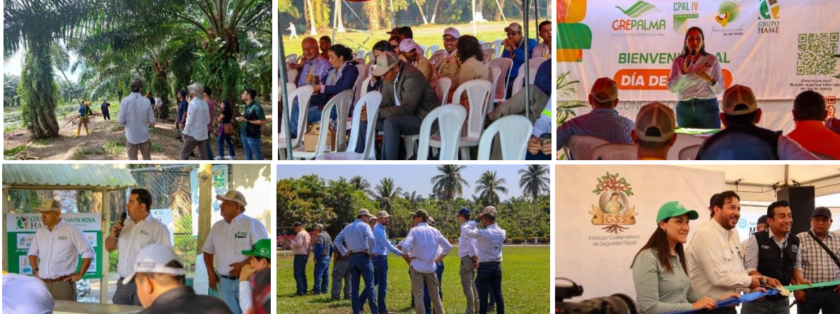
Imagen 4: Día 1 miércoles 28 de febrero - Día de campo.