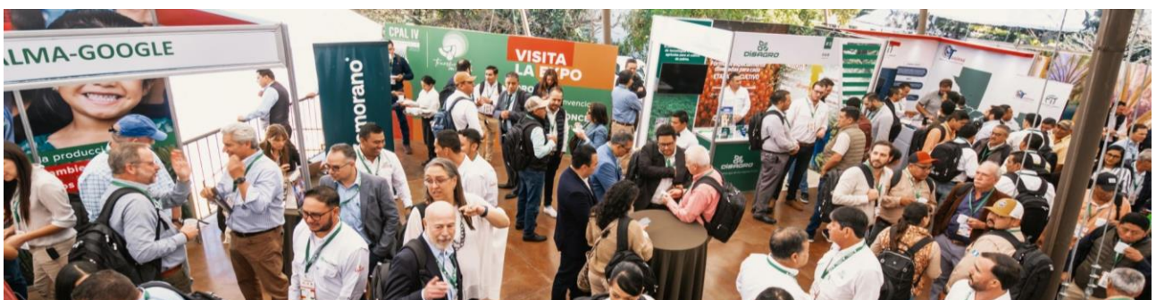
Imagen 7: Asistentes del evento día 2.