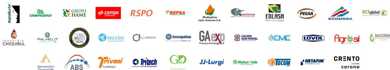
Imagen 3: Patrocinadores Oro y Plata de la IV edición.

En el siguiente enlace podrá encontrar el directorio de los socios, junto con sus datos de contacto: Directorio-de-socios-2023.pdf ( grepalma.org )