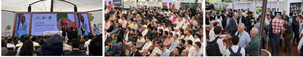
Imagen 5: Día 2 jueves 29 de febrero – Inauguración, plenarias y módulo de experiencias.