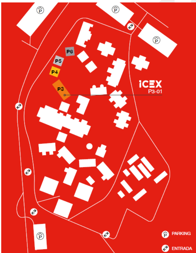
Plano del recinto ExpoCuba, con el Pabellón Oficial ICEX (pabellones 3, 4, 5, y 6) resaltado.

Tras dos años sin feria por la crisis sanitaria de la COVID-19, en 2022 se retomó su celebración. ICEX España Exportación e Inversiones y la Oficina Económica y Comercial de España en La Habana coordinaron nuevamente la participación española a través de un Pabellón Oficial que fue acompañado de una serie de actividades institucionales y de promoción. Dicho Pabellón Oficial agrupó un total de 41 expositores españoles pertenecientes a diversos sectores que ocuparon los pabellones 3, 4, 5 y 6.