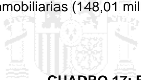
CUADRO 17: FLUJO DE INVERSIONES DE ESPAÑA EN EL PAÍS

687,58 millones de euros y a 68,68 millones en 2021. El stock de inversiones de Austria en España ascendía en 2021 a 1.231,07 millones de euros (1.573,8 millones en 2020). Por sectores, los dos principales en 2021 son el comercio mayorista e intermediarios de comercio (423,91 millones de euros), el de juegos de azar y apuestas (338,05 millones) y el de actividades inmobiliarias (148,01 millones).